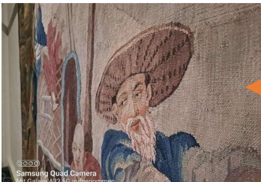
Tapissérie ancienne « pêche chinoise »